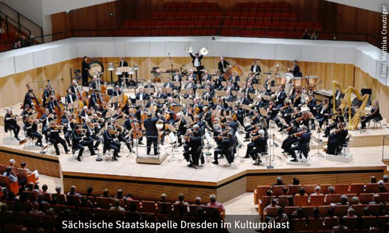
Sächsische Staatskapelle Dresden im Kulturpalast

MITTWOCH | 25. JUNI 2025 | 20 UHR KULTURPALAST DRESDEN