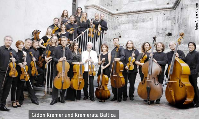
Gidon Kremer und Kremerata Baltica